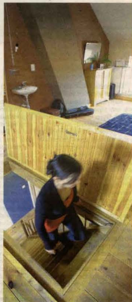
Op de eerste verdieping slaapt het koppel en er is een luxueuze badkamer.