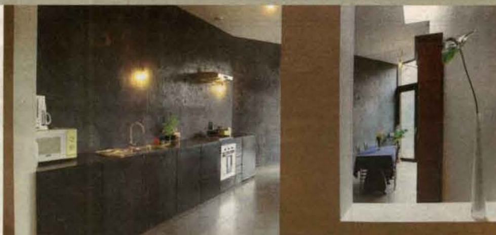
Dé blikvanger in het huis is de muur in Marokkaanse tadelakt, die doorloopt tot in de stadstuin.