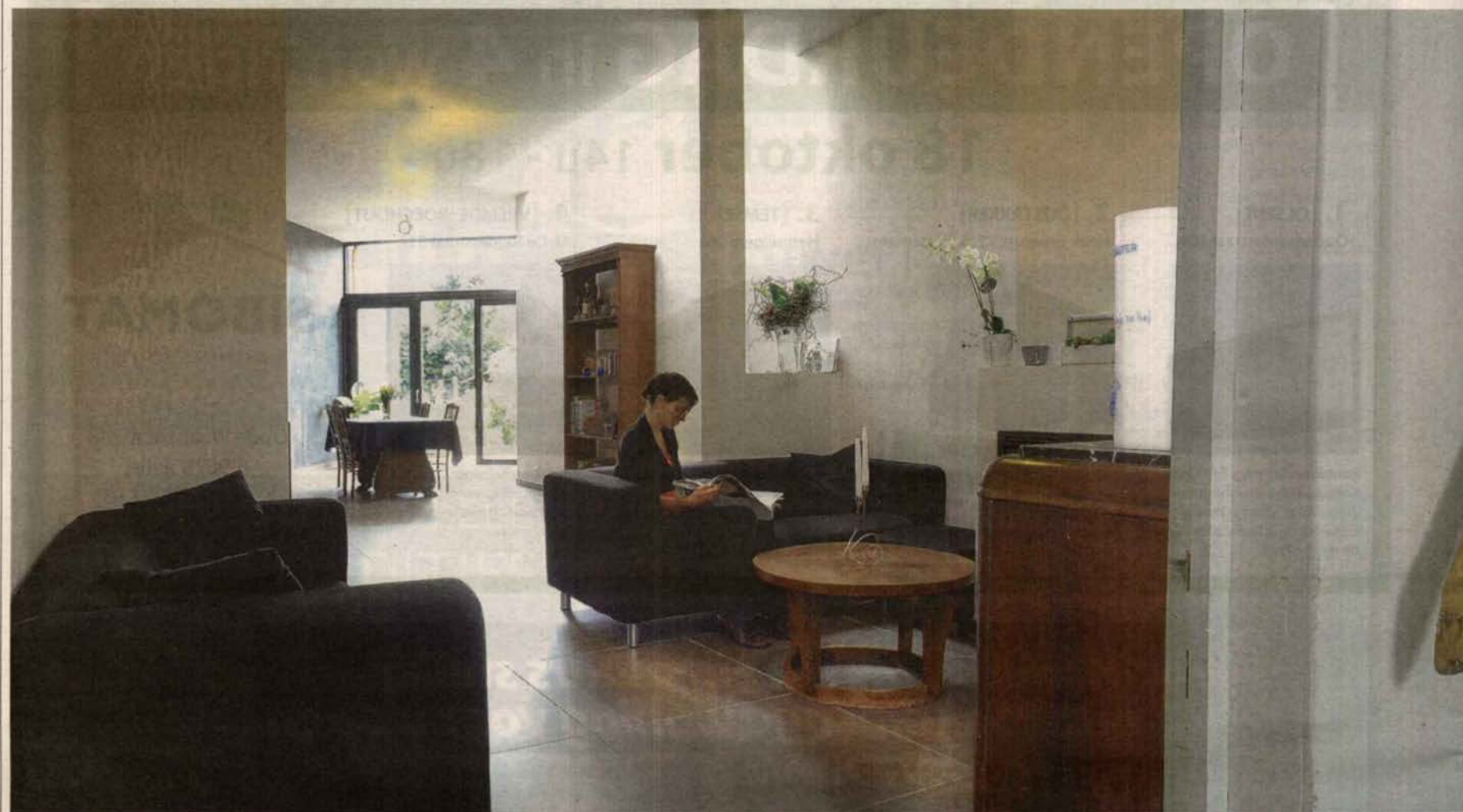
Dankzij de achtergevel in glas en een lichtstraat in het dak is er in de woonkamer veel natuurlijk licht.