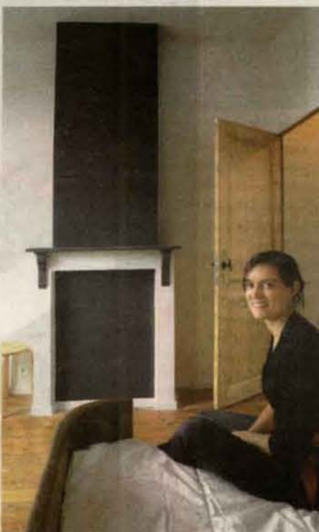
De muren zijn geschilderd met natuurverven.