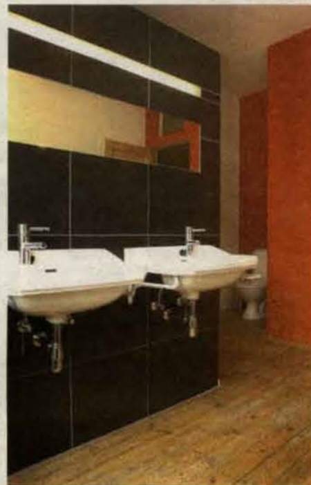
Onder andere in de badkamer werd de originele plankenvloer behouden.