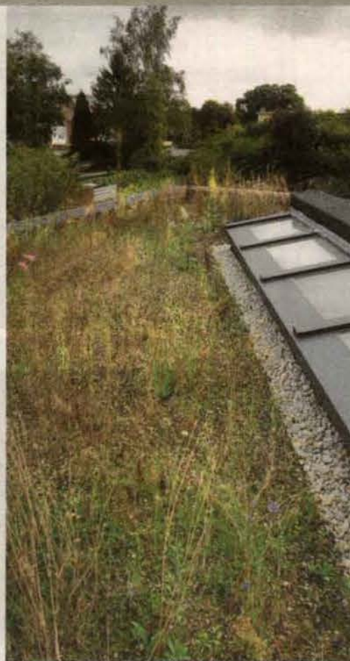
Het zicht vanuit de slaapkamer: het groendak, extra isolerend en prachtig in de lente.